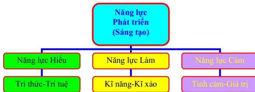
Hình 1. Các thành phần kinh nghiệm xã hội phản ánh những năng lực chung nhất của con người

Theo Đặng Thành Hưng: “Năng lực (competency) là thuộc tính cá nhân cho phép cá nhân thực hiện thành công các hoạt động nhất định, đạt kết quả mong muốn trong điều kiện cụ thể” [5]. Hiện nay, cấu trúc của năng lực được mô tả dưới nhiều phương diện khác nhau, nhưng nếu xét về bản chất của học tập là quá trình cá nhân hóa các thành phần kinh nghiệm xã hội (tri thức, kĩ năng và tình cảm) thì tiếp cận mô hình CTNL theo các thành phần kinh nghiệm xã hội của Đặng Thành Hưng (Hình 1) là thuyết phục hơn cả, nó được nhiều nhà giáo dục ủng hộ, áp dụng và phát triển trong từng lĩnh vực cụ thể.