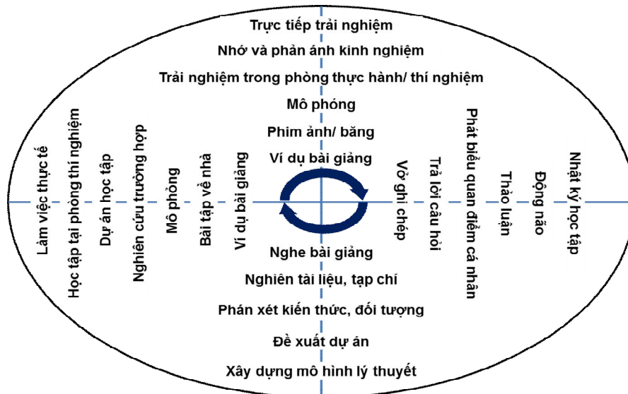
Hình 3. Hiệu quả một số hoạt động HTTN

Để giúp giáo viên dễ dàng áp dụng mô hình HTTN của Kolb trong đào tạo theo năng lực, chúng tôi định hướng một số hoạt động HTTN tương ứng với bốn giai đoạn học tập làm căn cứ để giáo viên có thể thiết kế hoạt động trải nghiệm cho người học (xem Hình 3).